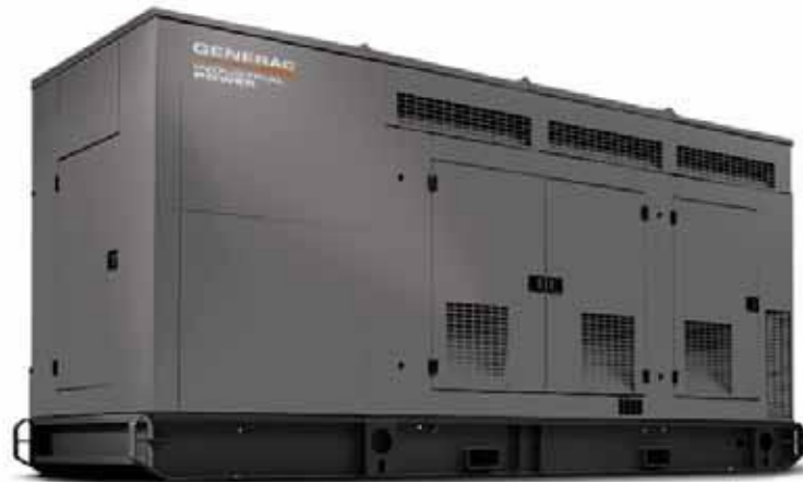
Изображение для иллюстрации